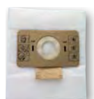
1 x sac microfibre (GP 1/16 A) SA 101 (FTDP00453)